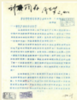
1956年2月钱学森起草了《建立我国国防航空工业意见书》

钱学森回国之时，发展现代科技正成为新中国的当务之急。面对是优先发展导弹还是飞机的争议，钱学森在周恩来总理的支持和鼓励下，起草了《建立我国国防航空工业意见书》，为中央军委做出发展中国导弹技术的战略决策提供了重要支撑。此外，他还参与制定了我国空间技术研究计划。