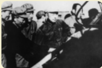
1960年钱学森(前左四)在某导弹基地指导工作

1956年3月，钱学森主持完成了《喷气和火箭技术的建立》，喷气和火箭技术被纳入国家长远规划。1963年，他主持制定了“八年四弹规划”，为中国导弹和运载火箭技术发展指出了正确的发展道路。20世纪70年代中期，他又提出了研制第二代战略导弹的建议。