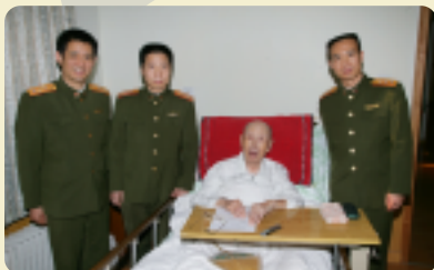
2006年1月10日杨利伟、费俊龙、聂海胜看望钱学森

1968年2月钱学森提出对我国载人航天发展规划进行研究的建议。经他和其他科学家倡议，1970年7月我国正式启动“曙光号”载人航天工程。“曙光号”搁浅后，他一直坚持相关探索性研究。他在方案论证和决策中发挥重要作用，悉心培养造就航天医学科技人才队伍。20世纪80年代中后期，他积极倡导从飞船起步的符合中国国情的载人航天战略。