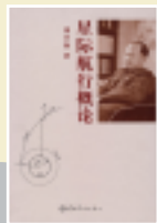
《星际航行概论》新版封面

从20世纪40年代到60年代初期，钱学森在火箭与航天领域提出了若干重要的概念：在20世纪40年代提出并实现了火箭助推起飞装置(JATO)，使飞机跑道距离缩短；在1949年提出了火箭旅客飞机概念和关于核火箭的设想；在1953年研究了星际飞行理论的可能性。