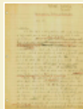
1946年发表的稀薄气体力学论文原稿的第一页

钱学森于1946年发表论文，从空气动力学观点总结了有关稀薄气体的研究成果，指出在几十公里高空飞行时将会遇到稀薄气体动力学问题。他提出稀薄气体动力学中三个流动领域的划分，为研究稀薄气体动力学作出了开创性工作。这一研究对卫星、载人飞船或航天飞机的发展起着重要的作用。