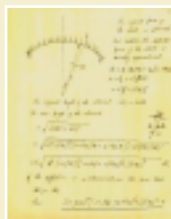
1940年前后，钱学森先后发表了数篇关于壳体弯曲问题的重要论文。图为他关于球壳外压弯曲的部分手稿。

20世纪30年代末，全金属结构飞机开始全面取代早期的木布结构飞机。薄壳失稳问题成为困扰航空学界多年的一个不解之谜。钱学森通过深入系统的研究，解决了这一航空学界久攻不克的难题。