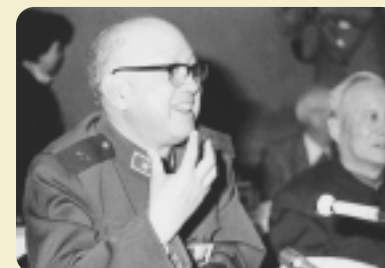
钱学森在讨论“七五”计划草案时发言