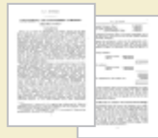
钱学森1948年发表的英文论文

技术科学思想建立于20世纪上半叶是历史发展的必然结果。首先觉察到这一点，把它准确地、完整地勾画出来并指出这是一个新的科学领域，则是钱学森的巨大功绩。