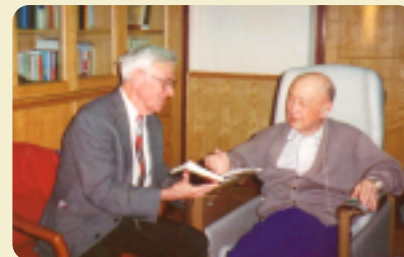
1996年钱学森先生和Marble教授亲切交谈

1939年，钱学森在冯·卡门的指导下，对空气的压缩作用提出了修正理论公式，即“卡门-钱近似”公式，解决了“如何改进飞机机翼的设计以消除空气的压缩效应对高速飞行的制约”这一难题，被广泛应用于飞机翼型的设计。