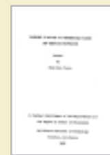
钱学森的博士论文封面